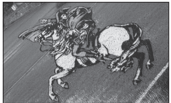
2º Trabajo en común de profesores en todos los Niveles, Áreas, Grados